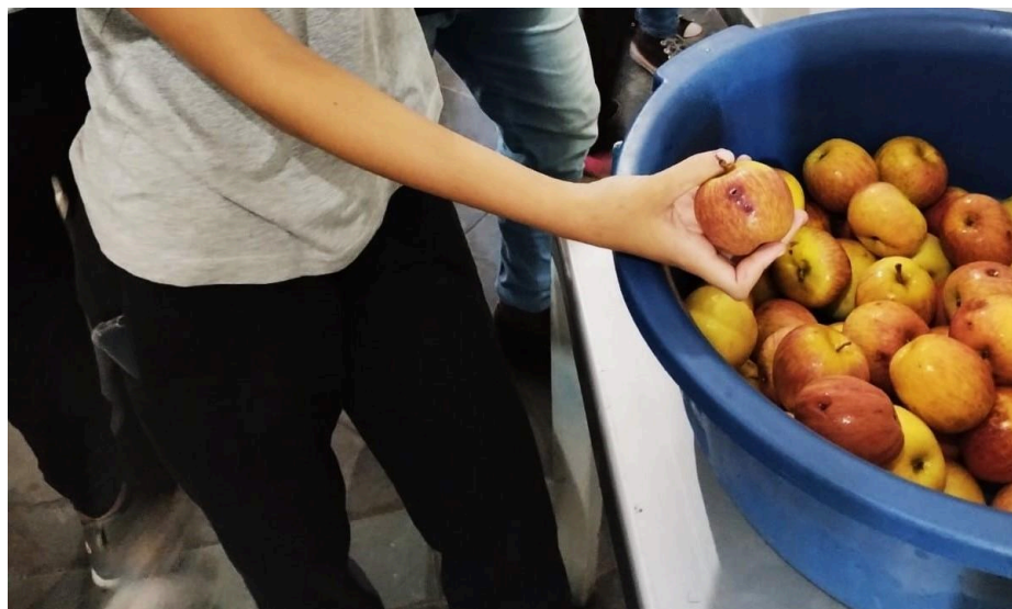
Foto 3: Fotografia capturada pelos estudantes e selecionada para representar o problema de “Bullying” na escola.

Foto 2: Fotografia capturada pelos estudantes e selecionada para representar problemas na merenda escolar.